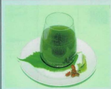
Ice or Hot Water