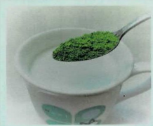
Milk or Yogurt